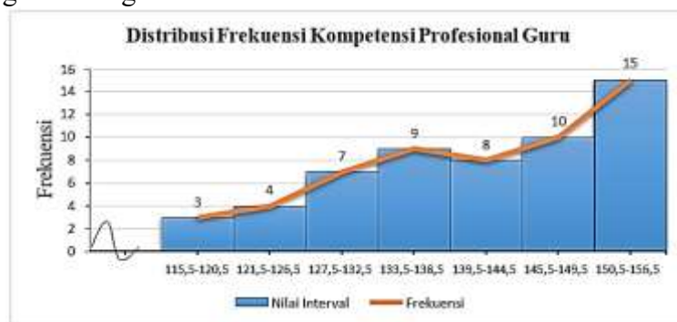
Gambar 4.1 Histogram Distribusi Frekuensi Kompetensi Profesional Guru (Y)

Distribusi frekuensi variabel kompetensi profesional guru (Y) dapat dilihat secara jelas dengan bentuk histogram sebagai berikut ini: