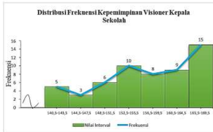
Gambar 4.3 Histogram Distribusi Frekuensi Kepemimpinan Visioner Kepala Sekolah (X)

Berdasarkan tabel 4.5 dan gambar 4.3, menunjukkan hasil perhitungan distribusi frekuensi menurut aturan Sturges (Kadir, 2015), diperoleh jumlah interval kelas sebanyak 7 dengan jarak kelas interval adalah 4. Sedangkan jumlah frekuensi sebesar 56. Skor rata-rata berada pada interval ke-3 dengan rentang skor 148,5-151,5 sebesar 86,6%. Tingkat kriteria skor yang diperoleh dapat dilihat pada tabel 4.6.